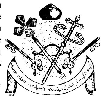
Embleem van de Syrisch-Orthodoxe Kerk