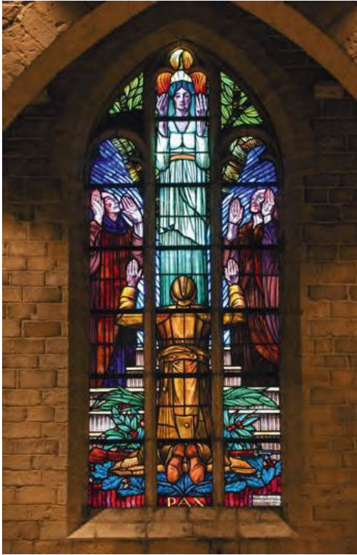
De Maagd van de Vrede

Boven de graven hangt een kruis met daarop een zegevierende Christus met koningskroon, teken dat de dag komt dat er geen rouw, jammerklacht of moeite meer zal zijn.