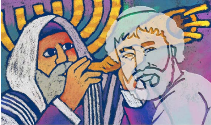
Illustratie: Roel Ottow

Jezus was een Jood, maar in de kerk hebben we van Hem een christelijke, kerkelijke Jezus gemaakt. Die is tenminste inpasbaar en hanteerbaar. We hebben Jezus naar ons eigen beeld herschapen. En dan verbleekt het Jood-zijn van Jezus zomaar, onopvallend.