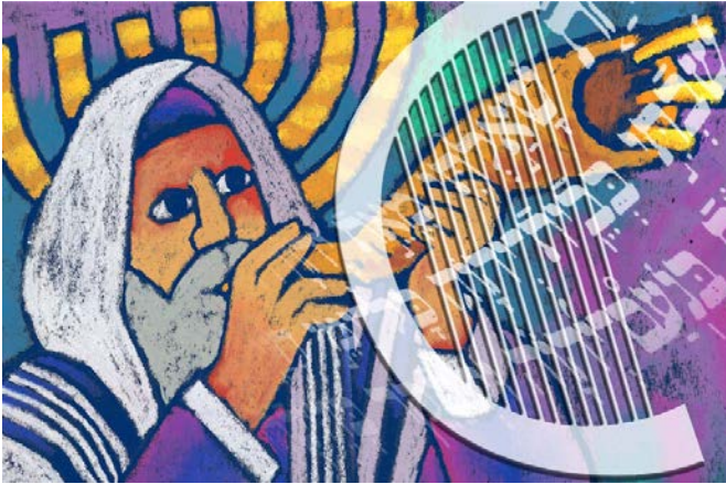
Illustratie: Roel Ottow

De Hebreeuwse Bijbel is niet alleen het Oude maar ook zomaar het Vergeten Testament. De psalmen die we zingen zijn oeroude joodse poëzie.