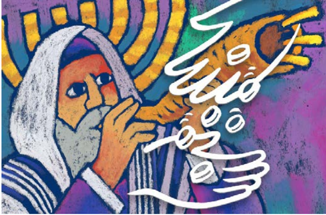
Illustratie: Roel Ottow

Het is niet overdreven te stellen dat de armenzorg in West-Europa via de kerk teruggaat op de joodse traditie van zorg voor elkaar.