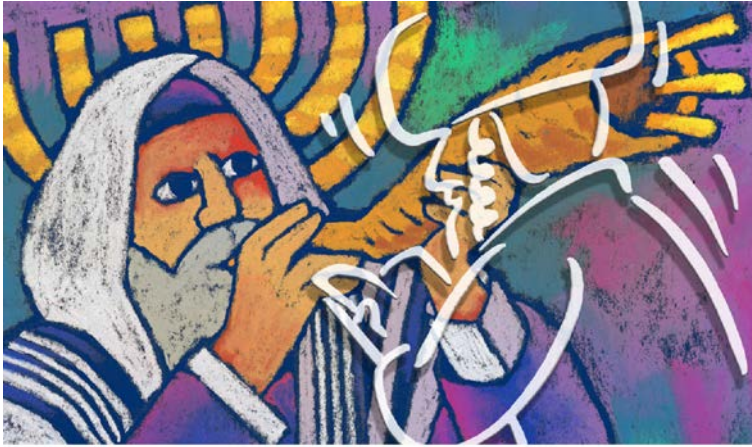
Illustratie: Roel Ottow

Wereldwijd wordt het Onze Vader in kerken gebeden. Je zou bijna vergeten dat het thematisch van huis uit een joods gebed is en dat het ons allereerst met de synagoge verbindt.