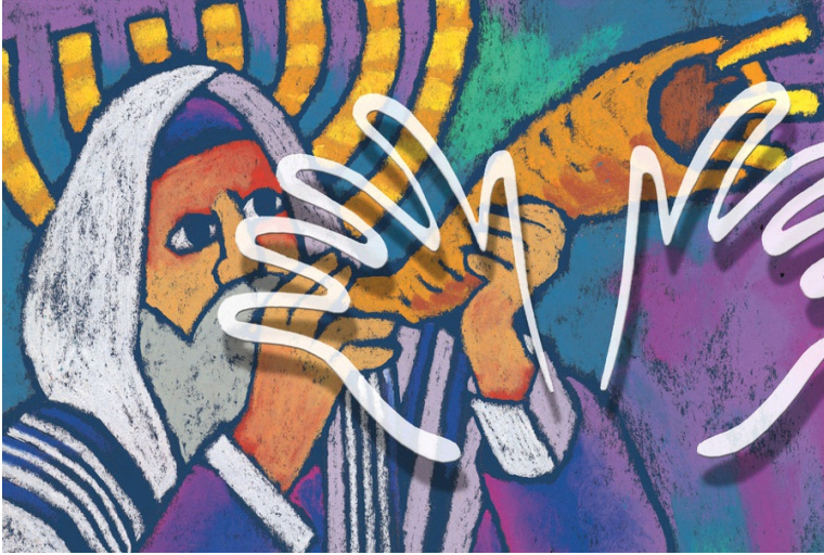
Illustratie: Roel Ottow

We hebben maar één 'echte' zegen in de Bijbel, van niemand minder dan God zelf. Dat is de priesterlijke zegen. Het stoort mij dan ook enigszins als kerkdiensten worden afgesloten met zelfbedachte zegenwoorden.